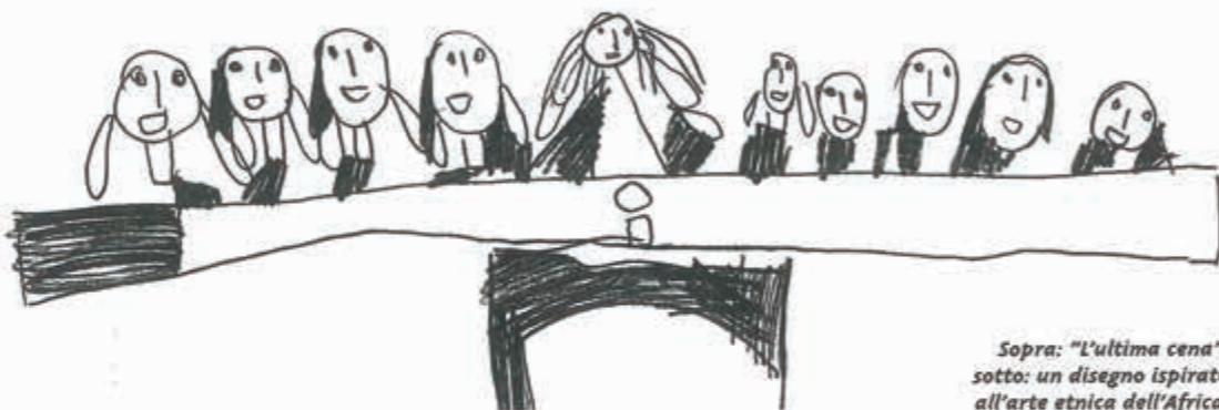
Sopra: "L'ultima cena"; sotto: un disegno ispirato all'arte etnica dell'Africa.