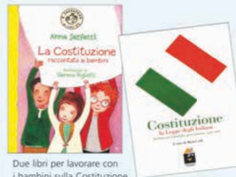
Due libri per lavorare con i bambini sulla Costituzione.

A. Sarfatti, La Costituzione raccontata ai bambini , Mondadori, Milano 2006.