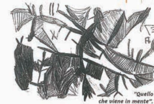
"Quello che viene in mente".