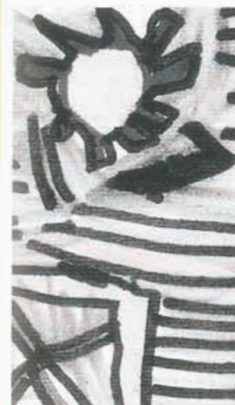
Sopra: "La luce"; nella pagina accanto: "Studio dell'occhio".

LORENZO B.: Quando uno si fa una foto e poi la porta dal fotografo.