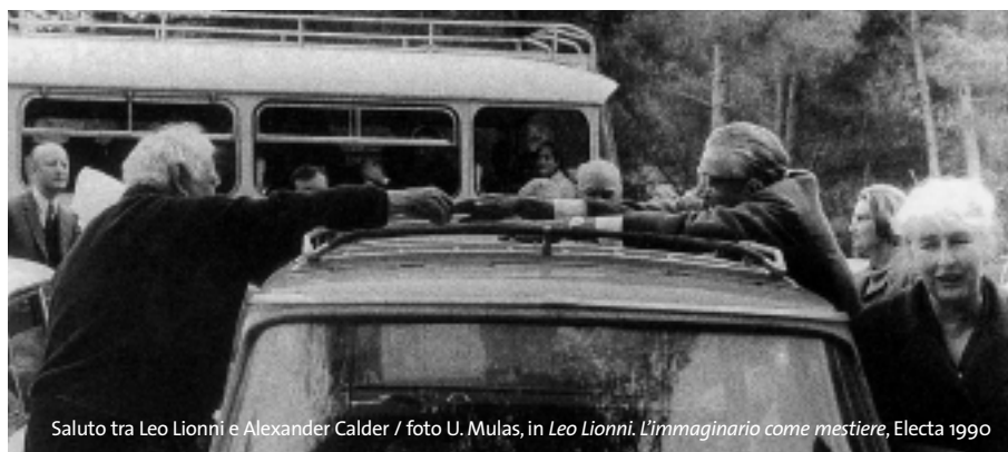
Saluto tra Leo Lionni e Alexander Calder

“Nell'autunno del 1990, in occasione della mia retrospettiva al museo di arte moderna di Bologna, fu organizzata una conferenza stampa la mattina dell'inaugurazione. Una giovane signora, la corrispondente italiana per Die Zeit , mi chiese: 'da quanto ne so lei è stato un buon amico di Alexander Calder. I nostri lettori vorrebbero sapere se lei potesse dare loro qualche frammento significativo di una conversazione tra lei e Calder. Potrebbe farlo?' Annuii. E le dettai la mia risposta lentamente: 'io gli dissi, sei un bravo ballerino, e lui rispose, anche tu sei un bravo ballerino'.