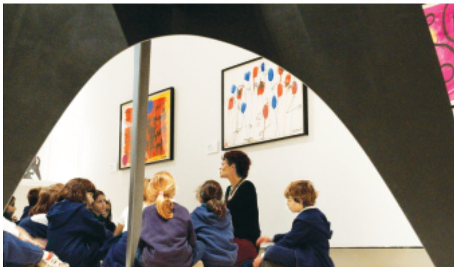
Calder e Lionni. Una storia di amicizia laboratorio

Nel testo di Lionni stati d’animo e situazioni sono comunicati attraverso semplici forme astratte che si muovono nello spazio della pagina seguendo precise regole compositive. Ai ragazzi si assegnano piccole forme ritagliate nel cartoncino, ispirate a quelle di Calder per creare diversi tipi di spazio: chiuso, aperto, disordinato, ordinato, vuoto, pieno. Scegliete la composizione che preferite e incollate le forme su un acetato trasparente. Ritagliate l’acetato intorno alle forme lasciando sottili collegamenti tra l’una e l’altra. La composizione si trasformerà in una struttura leggera da appendere con il filo trasparente.