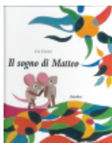
Il Sogno di Matteo prima edizione 1990

Il sogno di Matteo è il libro più autobiografico di Leo. Racconta la storia del topo Matteo, un sognatore. Matteo vive in una soffitta polverosa con i suoi genitori che sognano per lui un futuro da medico. Matteo non riesce a immaginare cosa farà da grande, fino al giorno in cui visita un museo con la sua classe. Nei grandi quadri esposti riconosce che nell'arte c'è tutto un mondo. Quella notte sogna colori e mondi fantastici. "Io voglio essere un pittore" esclama al risveglio. Lavora duramente, crea tante opere raggiungendo fama e successo. Infine incontra la sua amata Nicoletta.