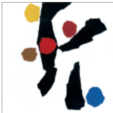
Leo Lionni da Piccolo blu e piccolo giallo , 1959

Suggerisce spunti di discussione e attività con schede di lavoro che, attraverso alcuni dei suoi libri più celebri, presentano la poetica dell'artista.