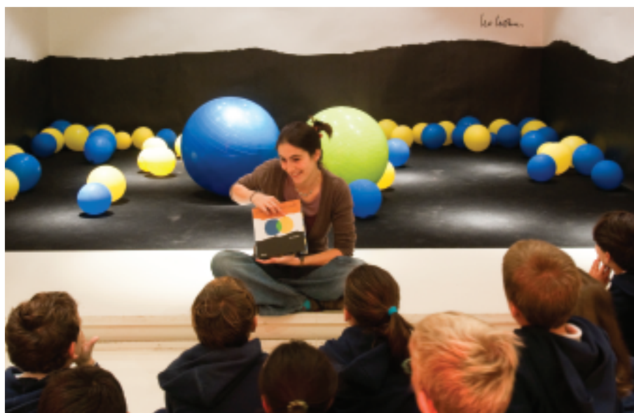
Calder e Lionni. Una storia di amicizia laboratorio

Per tutta la vita ricomincia a scorrere più ricca, con una nuova comprensione dei modi e dei colori dell'amicizia. Pubblicato nel 1959 è il primo libro per bambini di Lionni e segna una data importante nella storia dell'albo illustrato in America, dove diventa subito un best seller .