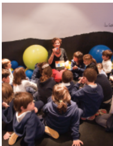
Calder e Lionni. Una storia di amicizia laboratorio