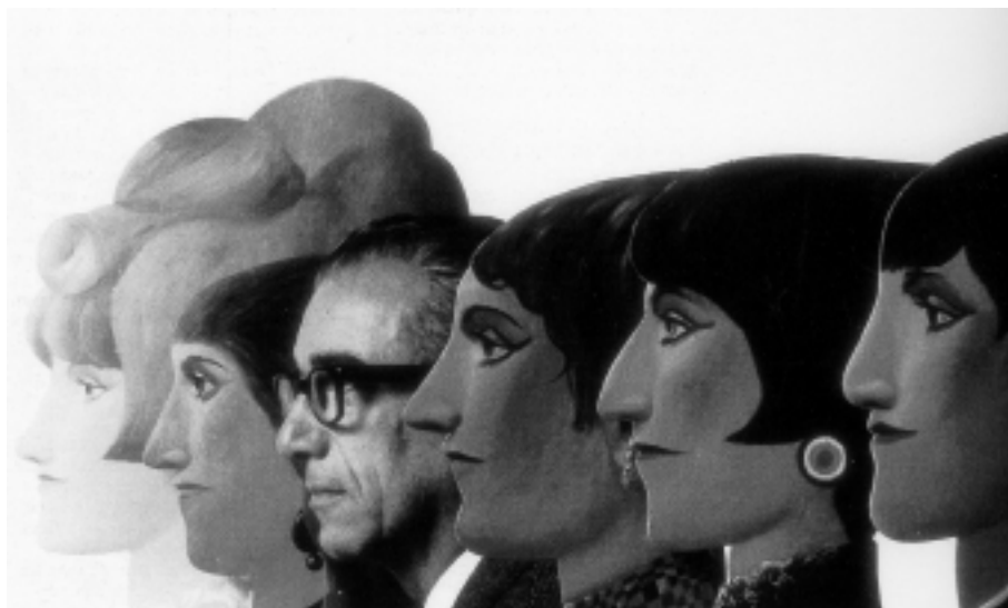
1966 Lionni fotografato in mezzo ai suoi Profili da Ugo Mulas. Milano, Galleria L'Ariete

Suo zio Piet gli regala matite e colori e gli insegna le tecniche del chiaroscuro . Leo inizia a dedicarsi al disegno, recandosi spesso al museo Rijks per copiare pitture e sculture. Tutti i libri di Leo partono dall'esperienza diretta e raccontano i suoi pensieri e le sue idee.