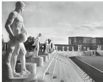
Stadio dei marmi, 1932. Roma.

In questa fotografia d'epoca – che raffigura lo Stadio dei marmi di Roma – l'inquadratura, la ripresa di scorcio e la luce che investe le sculture di età romana sono determinanti per comunicare l'immagine simbolica che il fascismo voleva dare di sé, quella del ritorno ai fasti dell'Impero romano.