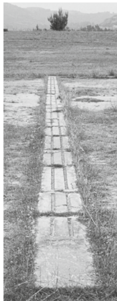
Linea di partenza, stadio di Olimpia, V sec. a.C. Peloponneso (Grecia).

I giochi ginnici servivano a esaltare le qualità naturali dell'individuo come l'agonismo, il coraggio e la forza. Le Olimpiadi furono soppresse dall'imperatore romano Teodosio nel 393 d.C. La prima delle Olimpiadi moderne vedrà la luce quindici secoli più tardi e si svolgerà ad Atene nel 1896.