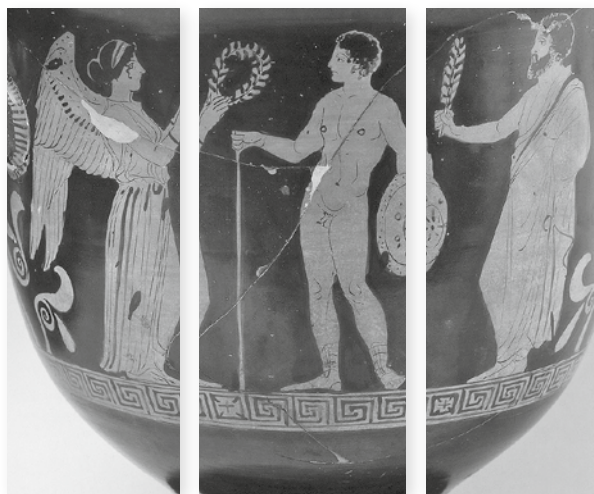
Incoronazione del vincitore, cratere attico a figure rosse, V secolo a.C.

Le pitture vascolari greche raffigurano spesso il momento della premiazione dell'atleta, come si vede in questo cratere che raffigura il vincitore di una gara incoronato con foglie d'alloro da una dea.