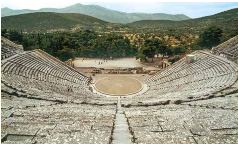
Teatro, 360 a.C. ca. Epidauro, (Grecia).