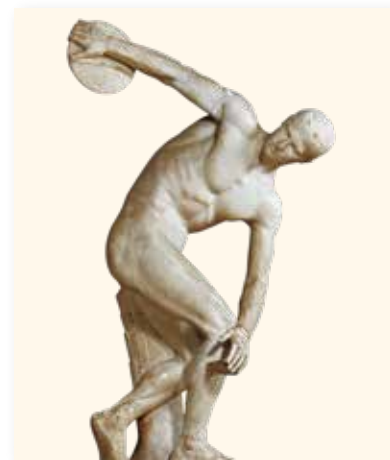
Mirone, Discobolo, copia romana da originale in bronzo del 450 a.C. ca.