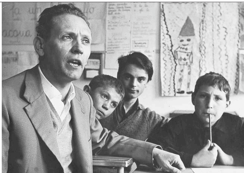
Vho di Piadena: in aula con alcuni alunni (1958) Foto di classe (1959).